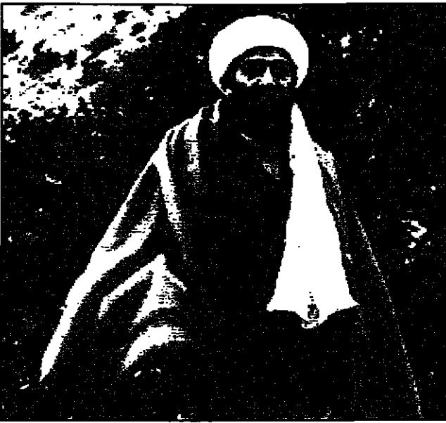
اسامة بن لادن

لندن - القدس العربي: دعا المعارض السعودي اسامة بن لادن والتعريف في برنامج تلفزيوني بريطاني.